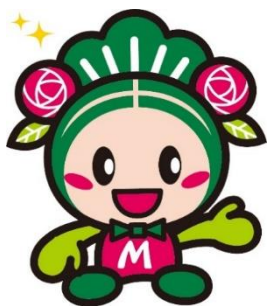
松原市マスコットキャラクター マッキー