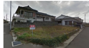
鹿児島県いちき串木野市(土地) 譲渡額約350万円