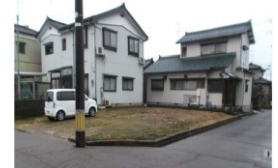
新潟県燕市(土地) 譲渡額約350万円