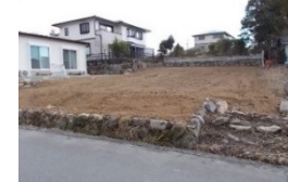
三重県津市(土地) 譲渡額約270万円