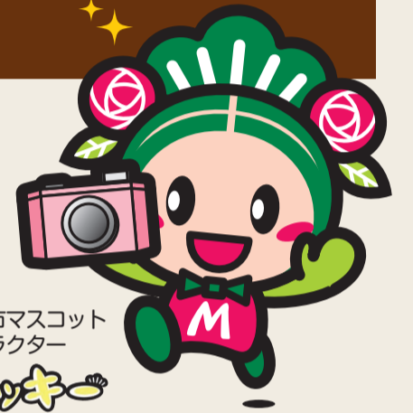
松原市マスコットキャラクター マツバ