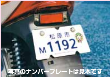
写真のナンバープレートは見本です

市では、従来の標識に加え、市制55周年の節目として、松原市の頭文字「M」の字型プレートに「マッキー」を描いた原動機付自転車、ミニ