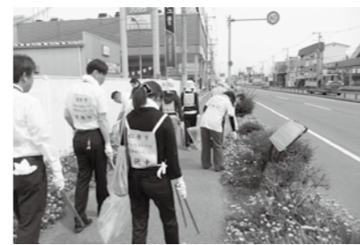
▶前回の美化キャンペーンの様子

市では今年第2回目の美化キャンペーンを実施するにあたり、個人でボランティアとして参加していただける人を募集します。 実施内容 市内主要道路に沿ってポイ捨てごみなどを回収 ※軍手、タオル、ごみ袋はお渡しします。 とき 11月22日(木) 午前9時～11時30分 集合場所 市役所前庭(市民プラザ)清掃場所 当日午前8時30分より清掃場所の案内をお渡しします。 申込み 11月9日(金)までに住所、氏名、電話番号を添えて、環境政策課窓口、FAX(337・3005)、またはメール(kanryo-seisaku@city.matsubara.osaka.jp)に環境政策課へ。 問合せ 環境政策課