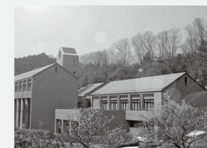
クリエート月ヶ瀬 検索

当施設ではスポーツ団体の合宿や家族での利用もできます。詳しい情報はホームページで! URL http://web1.kcn.jp/matubara-shizen/ 奈良県奈良市月ヶ瀬月ヶ瀬675番地 休館日 毎週火曜日 年末年始 TEL 0743-92-0041 FAX 0743-92-0044