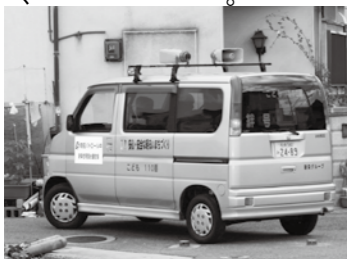
▲青色防犯パトロール活動

町会には、約260の町会があり、加入世帯の割合は約70%という状況で、年々その割合は減少しています（平成25年8月末現在）。