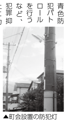
▲町会設置の防犯灯

「SCマンスリーまつばらは、世界基準の安心・安全なまちづくりセーフコミュニティについて知っていただくための連載コーナーです。」 ▼問合せ 市民安全課