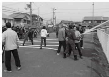
▲町会主催による防災訓練 町会には、約260の町会があり、加入世帯の割合は約70%という状況で、年々その割合は減少しています（平成25年8月末現在）。

町会には、約260の町会があり、加入世帯の割合は約70%という状況で、年々その割合は減少しています（平成25年8月末現在）。