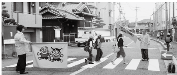
▲子どもの見守り活動

町会には、約260の町会があり、加入世帯の割合は約70%という状況で、年々その割合は減少しています（平成25年8月末現在）。