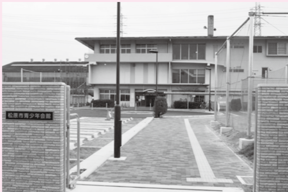
松原市青少年会館