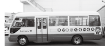
▲新型バス 前面・側面