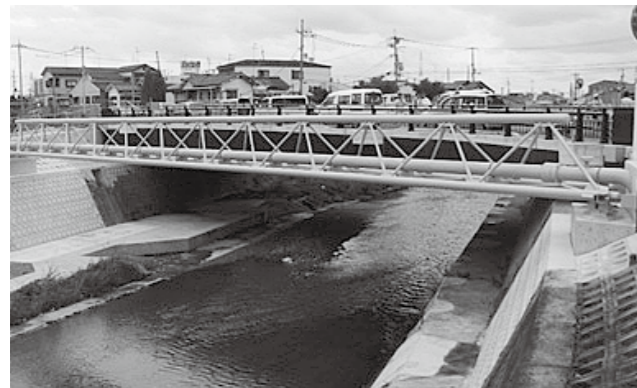
▲西除川にかかる水道管用の橋(水管橋)