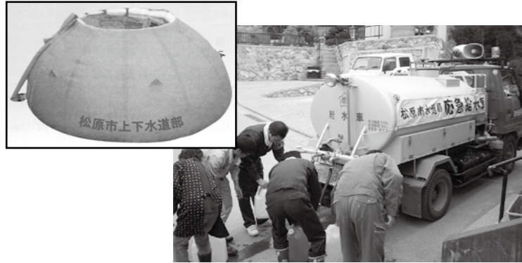
▲給水車による応急給水の様子(東日本大震災)

災害にそなえて 飲料水を備蓄しておきましょう 市では地震などの災害に備え、給水車を配備しています。 また、仮設応急給水槽(左写真)のような応急給水資機材の整備に努めています。 人間が生命を維持するために必要な飲料水の量は一人1日3リットルとされています。大きな災害に備え、日頃からご家庭に備蓄しておきましょう。 より万全な災害対策のためにも市民の皆さんのご協力をお願いします。