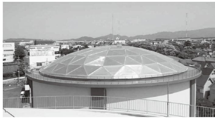
▲アルミドーム屋根を使用した災害に強い貯水タンク