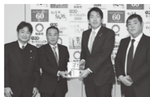
▲松原建設業協会様

タル長座体前屈計)を市に寄贈していただきました。 ▼問合せ 高齢介護課 ◎1月20日 一般社団法人 南大阪災害復旧支援協力会様 ◎2月6日 松原建設業協会様 今後、松原市の発展のために大切に活用させていただきま