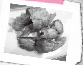
(食事バランスガイド 主菜2SV)

【材料】(4人分)さば三枚おろし4切れ、レタス少々、A(酒、しょうゆ各大さじ1と1/2、おろししょうが小さじ1)、B(小麦粉・片栗粉各大さじ2を混ぜておく)、サラダ油適宜 【作り方】①キッチン用のポリ袋にAを入れて混ぜておく。②さばは一口大にそぎ切りにし①のポリ袋に入れてもみ10分おく。③②にBを入れてさばにまぶす。④フライパンにサラダ油を1センチの深さで入れ中火で熱し、③のさばを1切れずつほぐして揚げ焼きにする。⑤レタスを添えて皿に盛る。*野菜たっぷり料理は「まったら愛つ娘～松原育ち～」で検索! 毎月市facebookでも配信中。▶問合せ 地域保健課