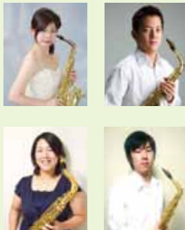
▲サクソフォンカルテット