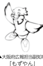
▲大阪府広報担当副知事「もずやん」

ます。昼間、仕事などで忙しい人や未納の市税がある人はご利用ください。 ◎休日窓口 12月20日(日) 午前10時～午後5時 ◎夜間窓口 12月18日(金)・21日(月) 午後8時まで ■市税の納付は便利な口座振替で 市税の納付に口座振替をご利用になると、金融機関などへ納付に行かなくても、納期限内に指定の預金口座から自動的に振替納付されますので便利です。 □口座振替の手続きは、納付書裏面に記載の金融機関や郵便局・ゆうちょ銀行または、納税課窓口へ申し込んでください。一度手続きされますと、毎年自動的に継続されます。 ▼問合せ 納税課