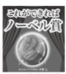
これができれば ノーベル賞

「これができればノーベル賞」 木野仁(著) 彩図社 これだけ科学が発達した現代においてもまだ実現できな い事、「タイムマシン」、「地震の予知」、「地球外生命体 の発見」など。現在の科学で、それらがどこまで可能でどの 部分ができないのかをわかりやすい文章で説明しています。