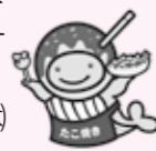
たこ焼き クーちゃん