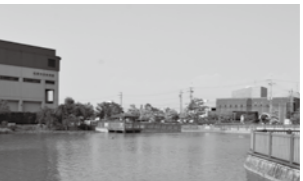
▲建設予定地(田井城今池親水公園内)

公募型プロポーザルのスケジュールなどの詳細については8月初旬頃に市ホームページへ掲載します。