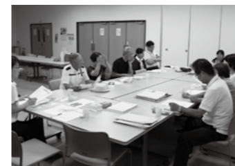
▲企画委員会の様子

7月4日、河合地区福祉委員会の企画委員会で「もしもキット」について説明を行いました。河合地区では高齢者見まもり活動の一環で活用を検討しており、実現に向けて話し合いを行いました。皆さんの地域でも見まもり活動に「もしもキット」を活用してみませんか。