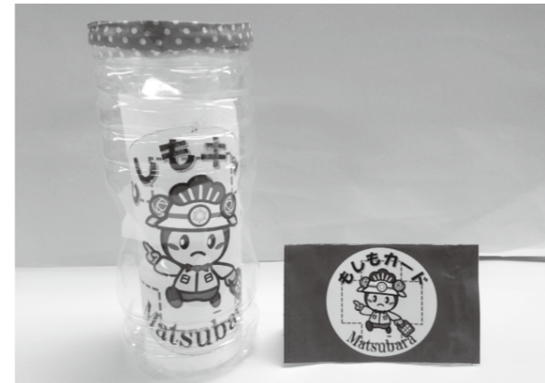
▲もしもキット・もしもカード