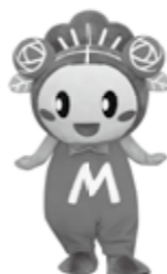
マッキーも来るぞ!

▼ ところ 大阪市平野区瓜破南1-3-14(駐車場は約10台程度あります) ▼ 内容 見学者通路には、アニメーションを交えた見学者用設備が備えられており、クイズコーナーやゲームコーナー(スタンプラリーなど)もあり、ごみ処理を分かりやすく説明しています。 ▼ 問合せ 環境政策課