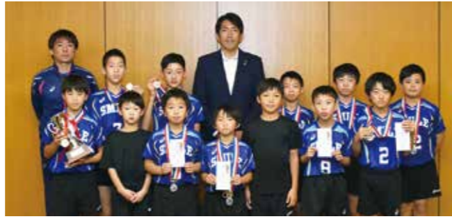
V.B.C SMILEの皆さん 「ファミリーマートカップ第37回 全日本バレーボール小学生大会 (平成29年度)」準優勝