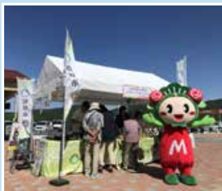
前回の宝塚北サービスエリアでの様子