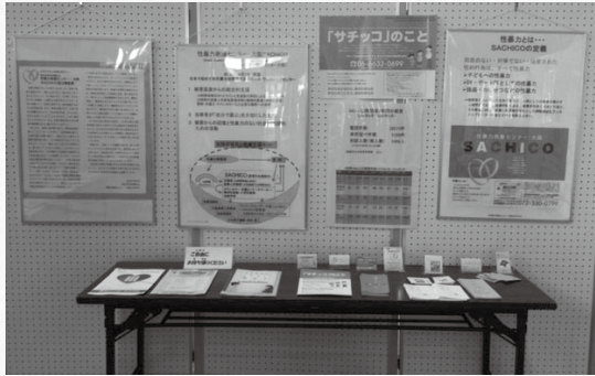
▲昨年のパネル展の様子