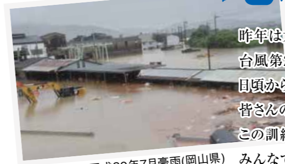
平成30年7月豪雨(岡山県) みんなで避難所に行きましょう!