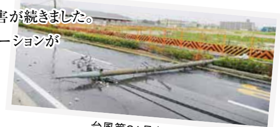
台風第21号(松原市内)

昨年は大阪府北部地震、平成30年7月豪雨、台風第21号など大きな被害を伴う災害が続きました。目頃からの隣近所との良いコミュニケーションが皆さんの命を守ることに繋がります。この訓練を機会に、声をかけ合い