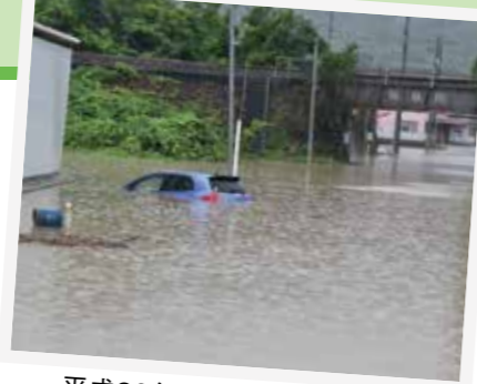
平成30年7月豪雨(岡山県)