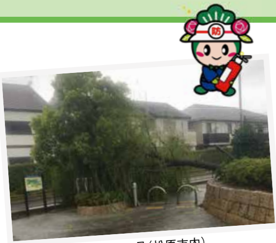
台風第21号(松原市内)

昨年は大阪府北部地震、平成30年7月豪雨、台風第21号など大きな被害を伴う災害が続きました。目頃からの隣近所との良いコミュニケーションが皆さんの命を守ることに繋がります。この訓練を機会に、声をかけ合い