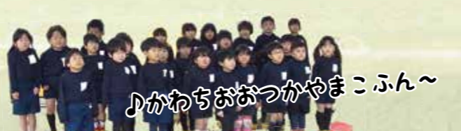
市立まつばら幼稚園の子どもたち