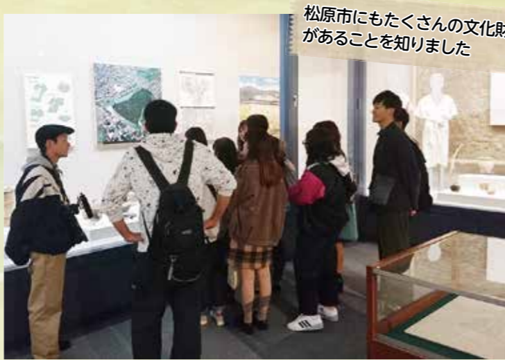
④ふるさとびあプラザの郷土資料館