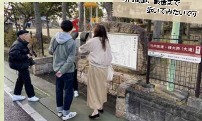
③竹内街道(岡公園碑)