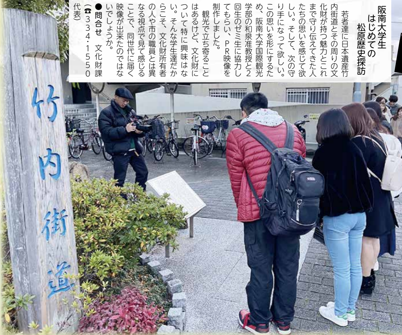
①竹内街道(緑の一里塚)