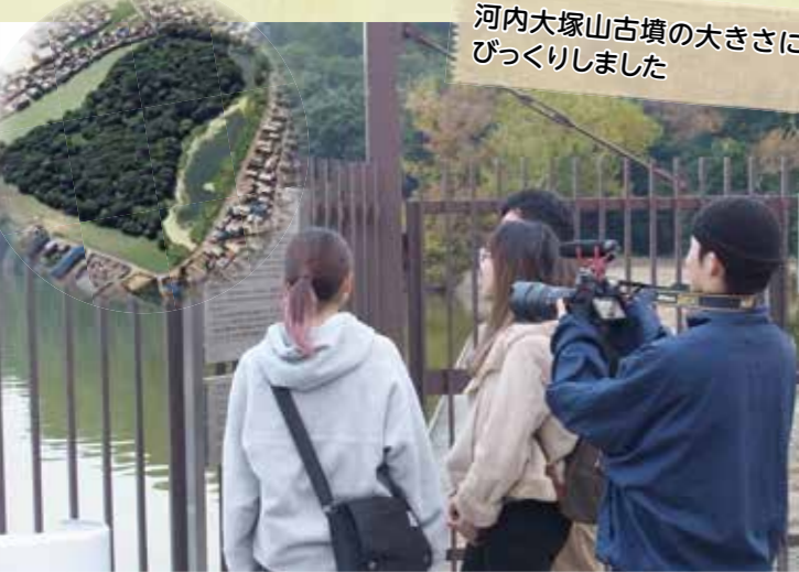
⑤河内大塚山古墳(左上は空撮)