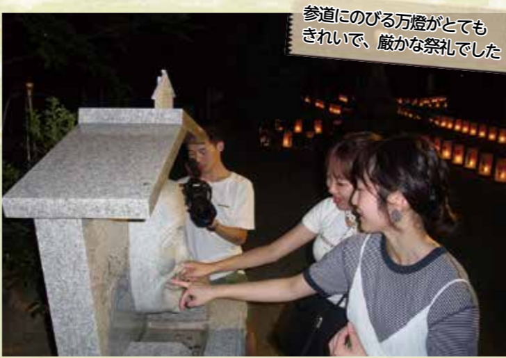
⑥柴籬神社内歯神社祭礼