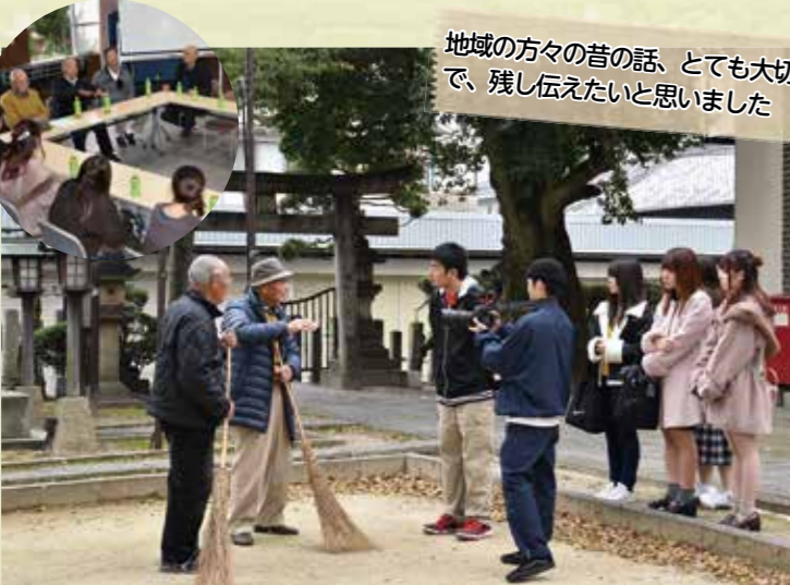
⑦丹南天満宮(左上は丹南天満宮で地元の人と交流)