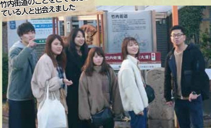
②竹内街道(松原南コミュニティセンター前)