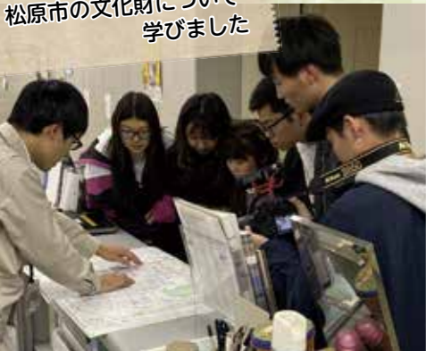
市役所文化財課で説明を聞く