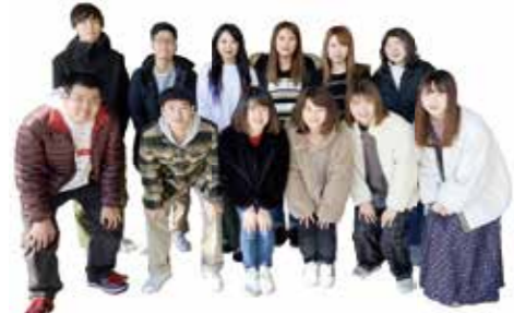
阪南大学国際観光学部の和泉ゼミの皆さん(撮影協力者)

松原の歴史・文化もっとみんなに知ってもらいたいです 松原のこともっと知りたかったです