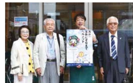
デイリーカーナートにて