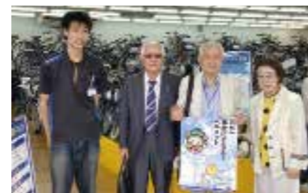
ダイワサイクルにて