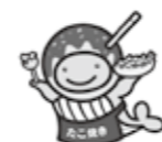
▲たこ焼きクーちゃん

ハロウィンジャンボ宝くじの当せん金は、1等・前後賞合わせて5億円。ハロウィンジャンボミニも同時発売。ハロウィンジャンボ宝くじの収益金は、市町村の明るく住みよいまちづくりに使われます。 【発売期間】9月23日(水)～10月20日(火) 【販売価格】宝くじ1枚300円 【備】インターネットからも宝くじは購入できます。詳しくは宝くじ公式サイトへ。 【問】公益財団法人大阪府市町村振興協会(☎06-6941-7441)