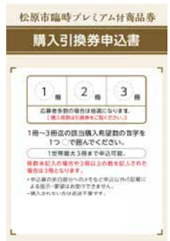
▲購入引換券申込書

商品券利用可能店舗については、ホームページなどでお知らせします。 商品券販売時には商品券利用可能店舗一覧を配布します。