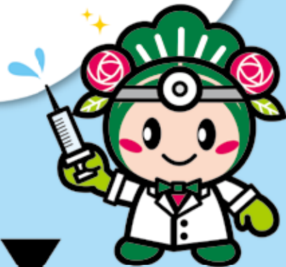
松原市マスコットキャラクター マッキー