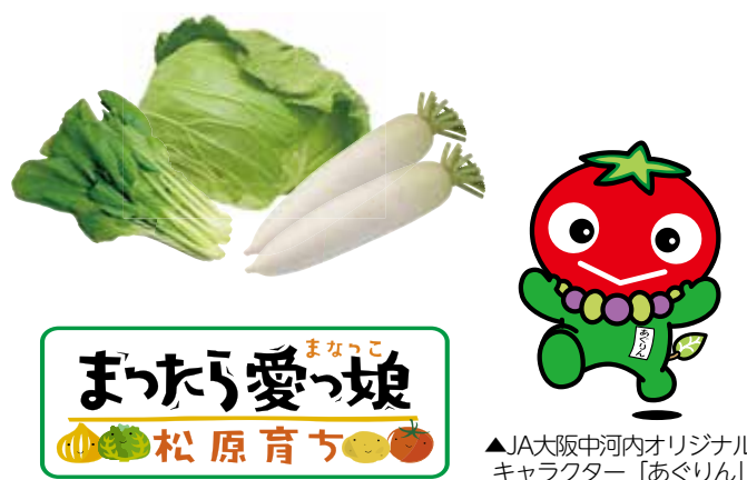
▲JA大阪中河内オリジナルキャラクター「あぐりん」