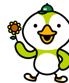
▲阪南大学公式マスコットキャラクター「はびなん」