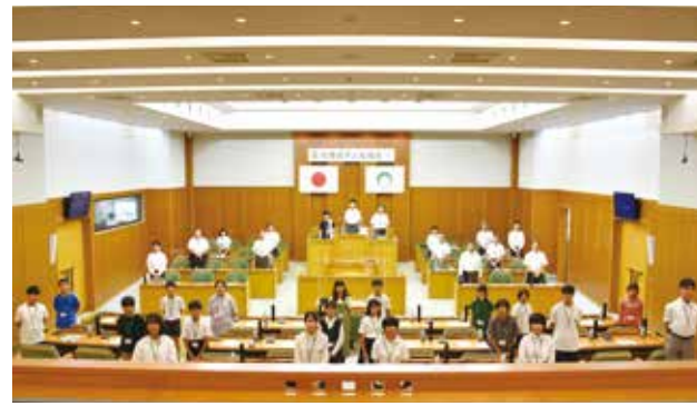
子ども議会に市内小・中学校の代表が参加しました 市役所の議場で「松原市子ども議会」を開催しました。市内の小中学校の代表が子ども議員として議場で質問をし、答弁を受ける形で行われました。子ども議員からは、コロナ対策やSDGs、安心安全なまちづくりについてなどたくさんの質問や提案が投げかけられ、答弁にも真剣に耳を傾けていました。(7月16日)