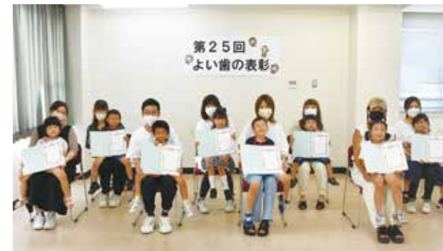
いつまでも健康できれいな歯を 「第25回よい歯の表彰」が市立保健センターで行われ、令和3年度に3歳6か月児健康検査を受診し、健康できれいな歯を持つ親子8組が表彰されました。これからも健康できれいな歯を保つために日々の手入れをこころがけましょう。(6月30日)