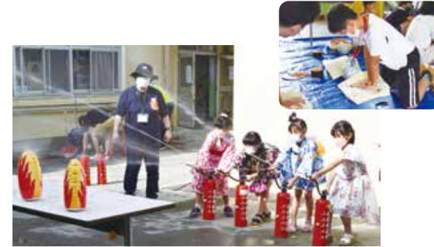
南っ子夏まつり 防災体験 松原南小学校の「土曜子ども体験」の一環として、AEDを使った救命体験や水消火器体験などの防災体験を行いました。消防士や松原防災士会の皆さんなどから命を守るための行動を教してもらい、参加した子どもたちは真剣に話を聞いていました。(7月9日)