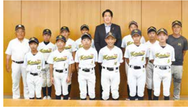
大阪松原の皆さん 「第15回春季全日本小学生男子ソフトボール大会」 出場