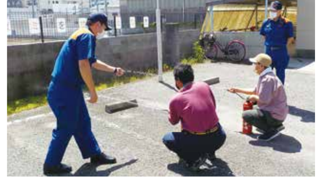
「市営別所・小川団地で消防訓練」を実施しました 市営別所団地・市営小川団地にて入居者による消防訓練が行われました。消火器の使い方や消防への連絡方法を確認するなど、いざという時に行動できるように訓練をしました。(6月11日)