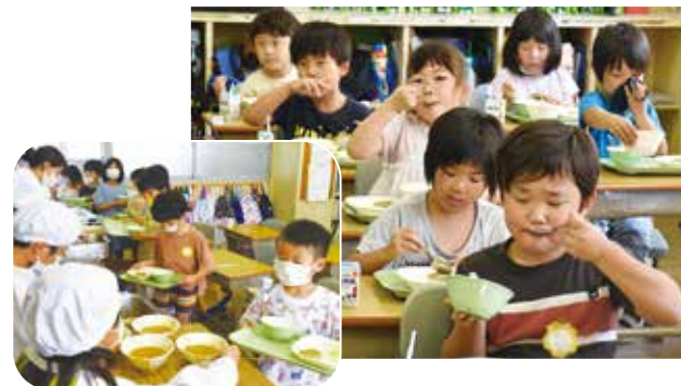
地元の名産品 河内鴨(合鴨)肉を使ったカレーをいただきました 使用した合鴨肉は、有限会社ツムラ本店より子どもたちに食べてもらいたいという思いから無償提供していただいたものです。子どもたちは、美味しそうにカレーを食べていました。(6月28日)