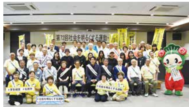
社会を明るくする運動・決起大会 社会を明るくする運動は罪を犯した人たちの更生について理解を深め、犯罪や非行のない地域社会を築くための運動で、今年は「まつばらテラス(輝)」で決起大会を開催しました。阪南大学ダンス部がダンスを披露し、元気あふれる賑やかな会場となりました。(7月1日)