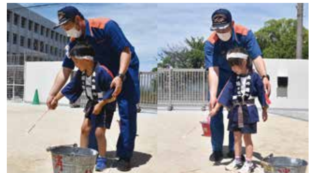
消防士と一緒におもちゃ花火の勉強 消防本部では夏休みを迎える前に、市内の幼年消防クラブ員を対象に「おもちゃ花火教室」を実施しました。わかば子ども園のクラブ員は、花火をする時は水バケツを用意し、必ず大人と一緒にすることなどを勉強し、安全に花火遊びを体験しました。(6月28日)