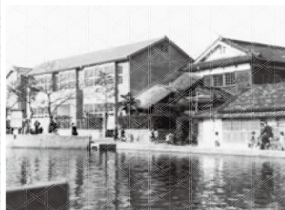
▲馬場池と三宅小学校 (左) 右側の建物は旧三宅村役場。屯倉神社は池の北側に鎮座し、「土師ヶ塚」は三宅小学校の南西にあたる。(昭和30年代)