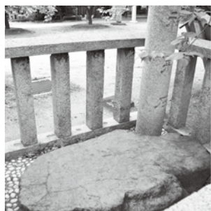
▲「神形石」 屯倉神社境内に保存されている。三宅の古墳からの出土と伝えられ、菅原道真が坐った休息石とも伝承される。