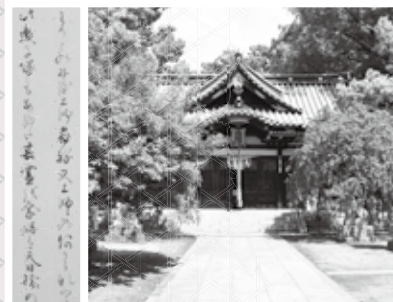
▲屯倉神社(三宅中4丁目)と『三宅天満宮梅松院縁起』 屯倉神社は穂日の社のあと、天慶5年(942)に菅原道真を祭神として創建されたと伝える。左は『縁起』の中の土師ヶ塚の記述。