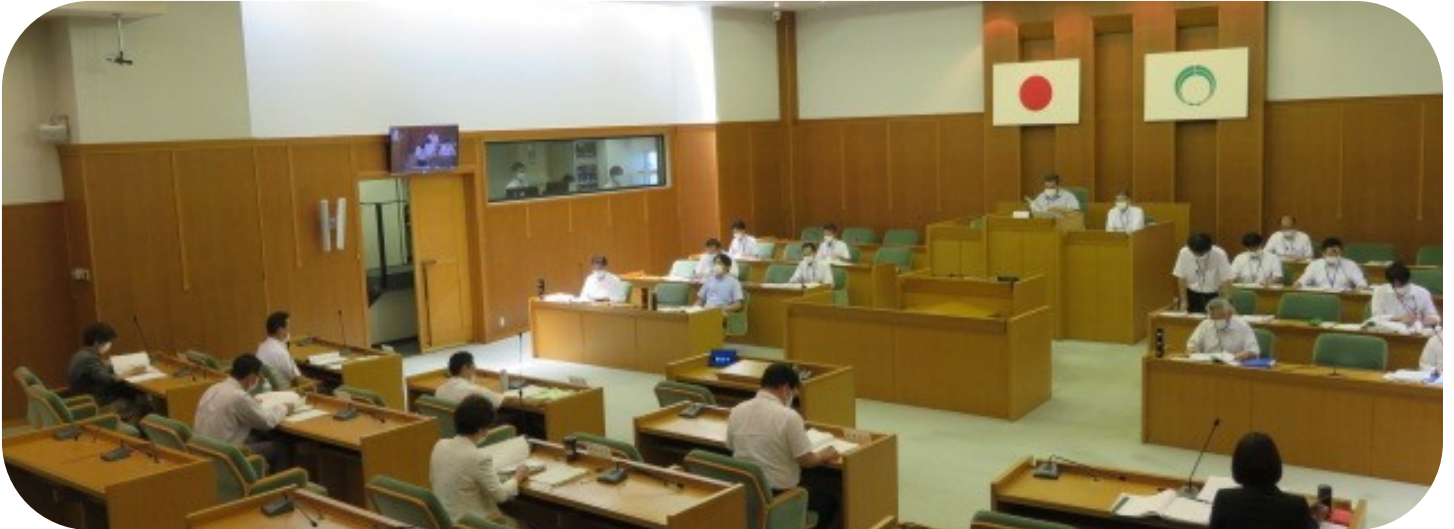
新型コロナウイルス感染症等拡大防止のため席の間隔を空けて会議を行いました。