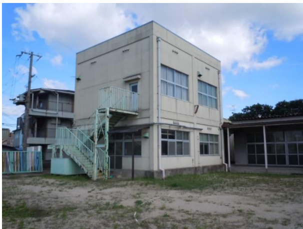
園舎（南東側2階建て）