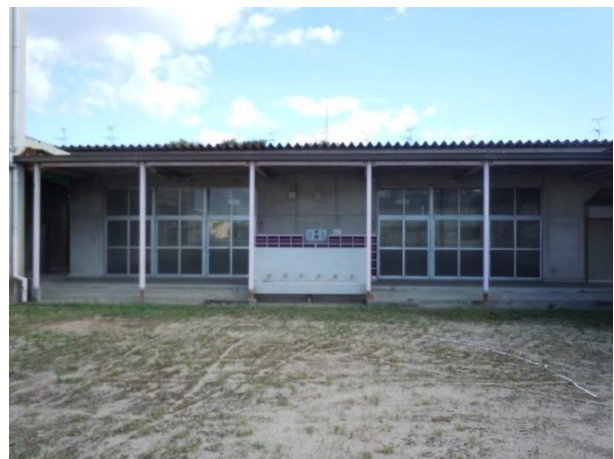
園舎（南西側平屋建て）