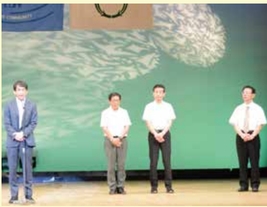
▲市内4校の代表あいさつ

9月8日に松原市文化会館で、セーフコミュニティ活動報告会を行い、会場には多くの市民の皆さんにお越しいただきました。 当日は、元希者クラブによる元希者エクササイズから始まり、生野高