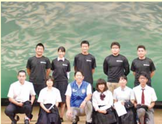
▲セーフコミュニティサポーターの任命式

9月8日に松原市文化会館で、セーフコミュニティ活動報告会を行い、会場には多くの市民の皆さんにお越しいただきました。 当日は、元希者クラブによる元希者エクササイズから始まり、生野高