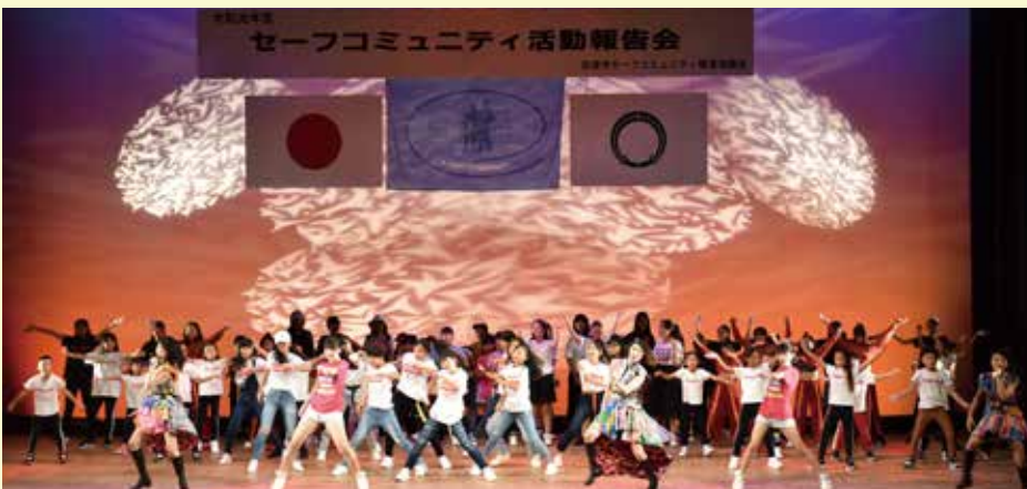
▲OSAKA翔GANGSとキッズダンサーによるパフォーマンス

次に、市が市民、各種団体と協働で取り組んでいる「子どもの安全対策委員会」「高齢者の安全対策委員会」「交通安全対策委員会」「犯罪の防止対策委員会」「自殺予防対策委員会」「災害時の安全対策委員会」の1年間の取り組みや成果についての報告が行われました。 その後、OSAKA翔GANGSの皆さんによる、セーフコミュニティをわかりやすく表現した演劇が披露されました。 最後は、松原市内のキッズダンサーも加わり大盛り上がりの中で報告会は幕を閉じました。 ●問合せ 市民協働課