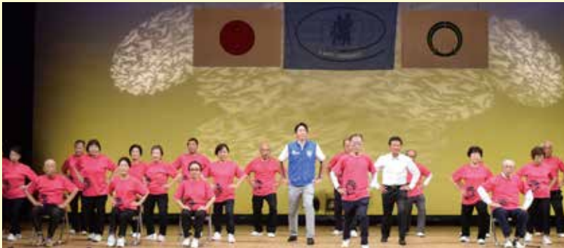
▲元希者エクササイズの様子