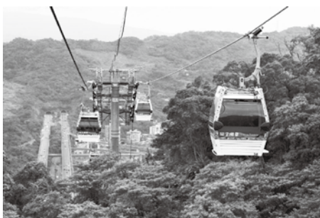
▲猫空ロープウェイ：文山区にある台北市立動物園から、台湾茶の産地として知られる猫空地区を結ぶロープウェイ

今回の訪問は、午後半日と短いものでありましたが、今後も文山区と積極的に交流を図り、セーフコミュニティのほか、他分野についても国際交流を深めていきたいと考えています。