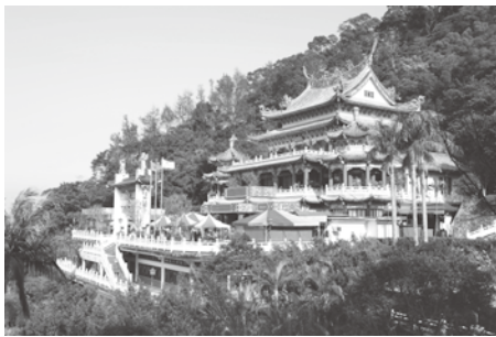
▲指南宮：文山区の木柵山の中腹にある有名な寺院