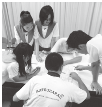
▲安全マップ作成中の様子