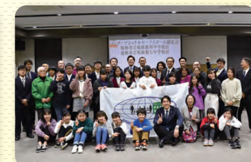
写真 令和元年度松原市地域教育協議会研修会 第26回松原市中学生生徒会交流 ISS認証式