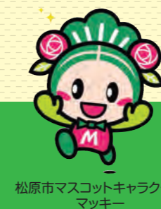
松原市マスコットキャラクター マッキー