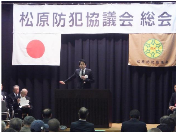
「松原防犯協議会・総会」(4月24日)