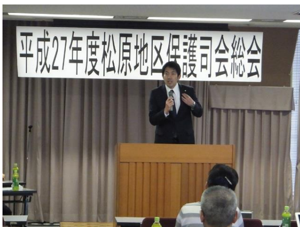
「松原地区保護司会・総会」(4月23日)

本年も松原地区保護司会の総会が開催されるにあたり、日頃のお礼とともに、挨拶をさせていただきました。更生保護活動を通して、明るい社会づくりに取り組まれ、本市の健康で安心・安全なまちづくりに対するご尽力に心から感謝申し上げます。