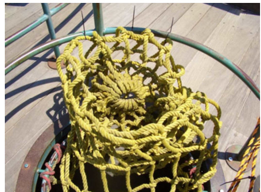
事故と同種のネット