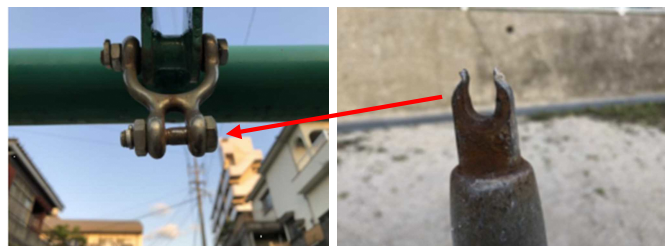
摩耗により上部がすり減り破断した吊り金具の状況（右写真）