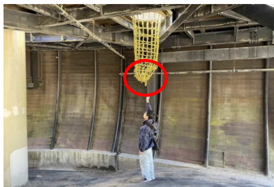
事故と同種のネット（袋状の下部が破れた）