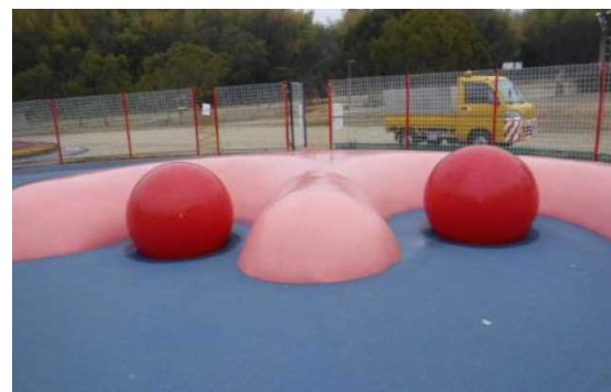
ボール（φ850）設置時の状況