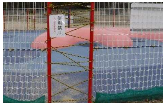
立入禁止措置状況