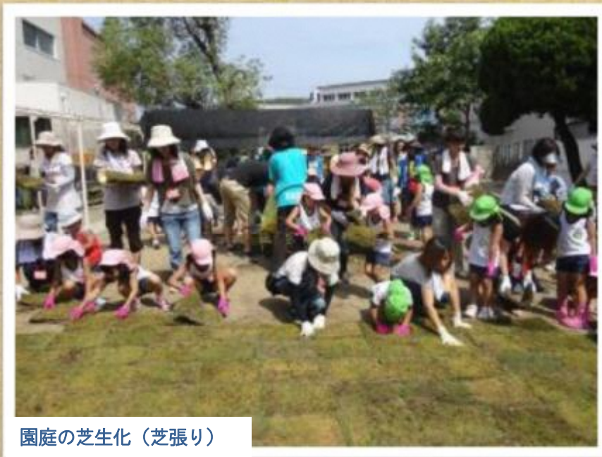
園庭の芝生化（芝張り）