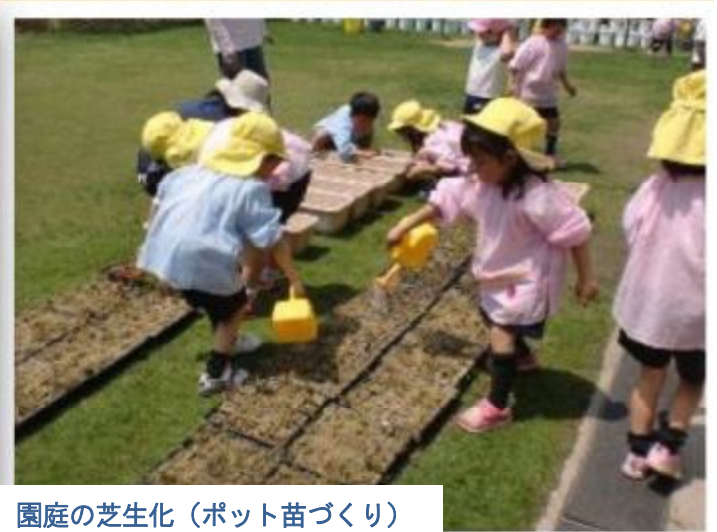
園庭の芝生化（ポット苗づくり）