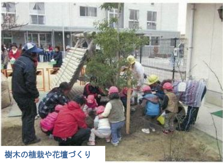
樹木の植栽や花壇づくり