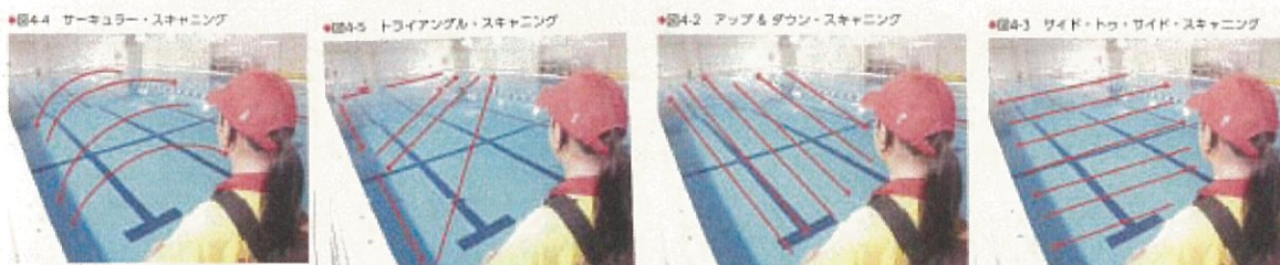
(出典：特定非営利活動法人日本ライフセービング協会編 2017年9月10日発行「プール・ライフガードング教本」P.35～36)

プール全体、子供たち全員を監視しましょう。 ・規則的に視線を動かしながら監視しましょう。