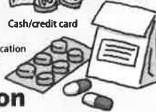
Current medication and schedule