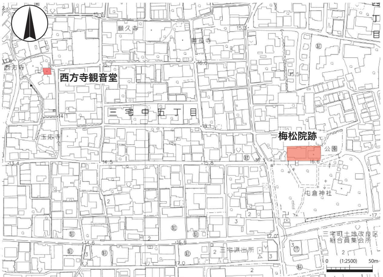
西方寺観音堂及び梅松院跡位置図