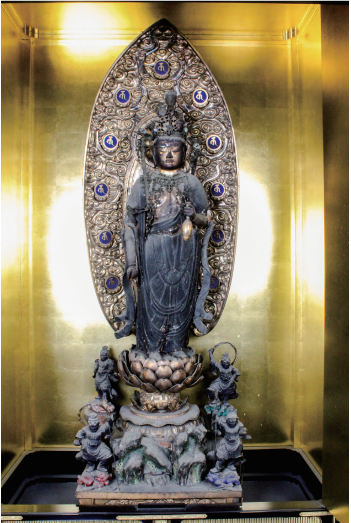
西方寺 木造 十一面観音立像