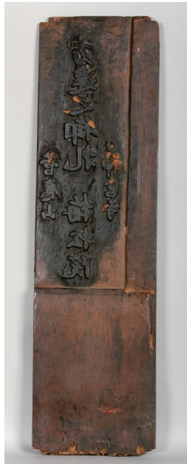
十一面観音立像 版木 (裏面)