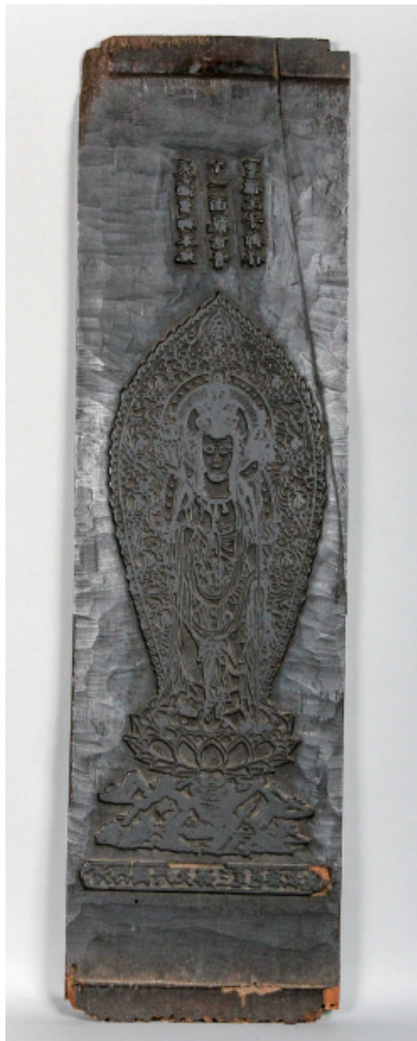
十一面観音立像 版木 (表面)