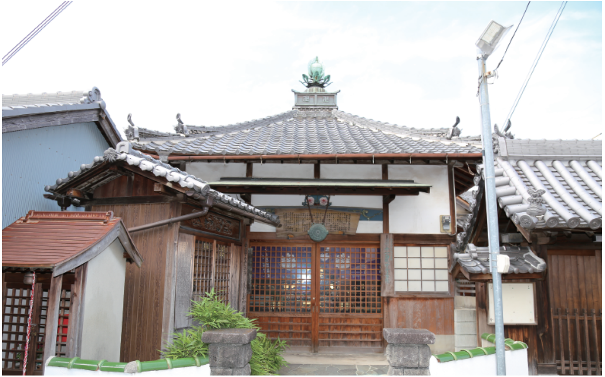
西方寺観音堂（東から）