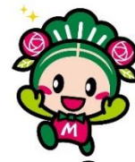
松原市マスコットキャラクター 「マッキー」

大阪府HP http://www.pref.osaka.lg.jp/kokuho