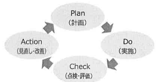
【図表3】PDCAマネジメントサイクル

本計画を効果的かつ着実に進行するためには、計画の定期的な点検と評価を基にした改善が不可欠です。そのために、前期計画より引き続き、Plan(計画)→Do(実行)→Check(評価)→Action(改善)のマネジメントサイクルを踏まえ、本計画に位置付けた各種施策の成果や課題について、主な事業の実施状況を点検・評価し、公表するとともに、その結果を施策の展開に反映させながら、効率的かつ効果的に推進します。