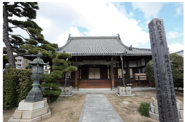
【写真7】 丹南・来迎寺 本堂（南から）