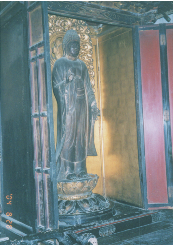
【写真4】 大保・西福寺での安置状況(1)