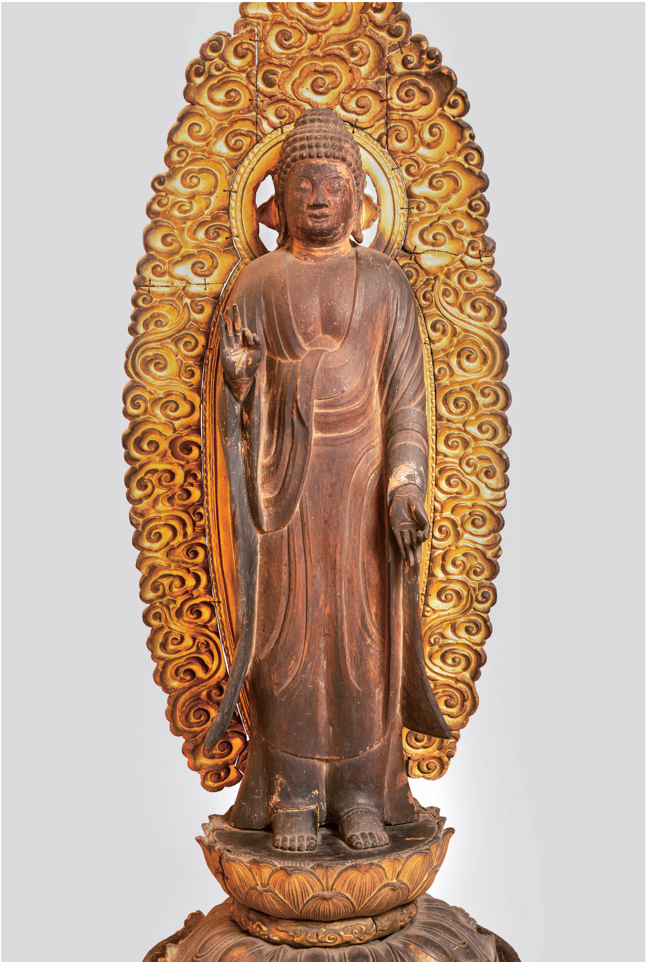
【写真1】 来迎寺木造阿弥陀如来立像