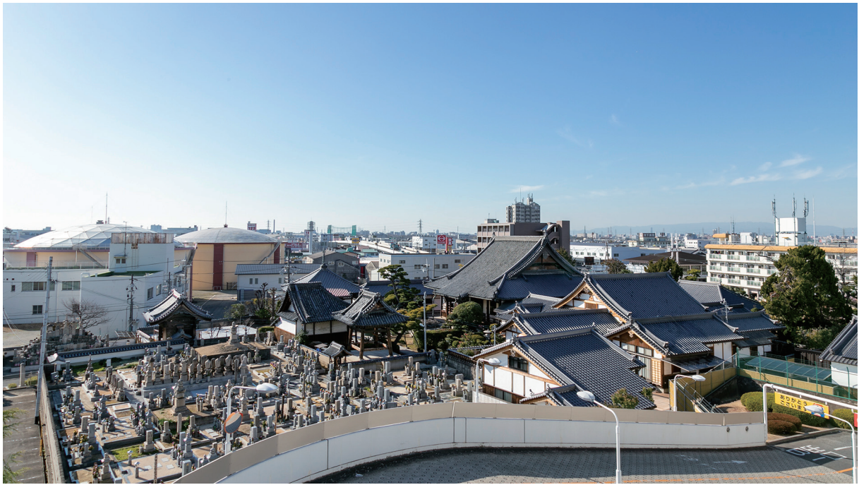
【写真6】 丹南・来迎寺 外観（東から）