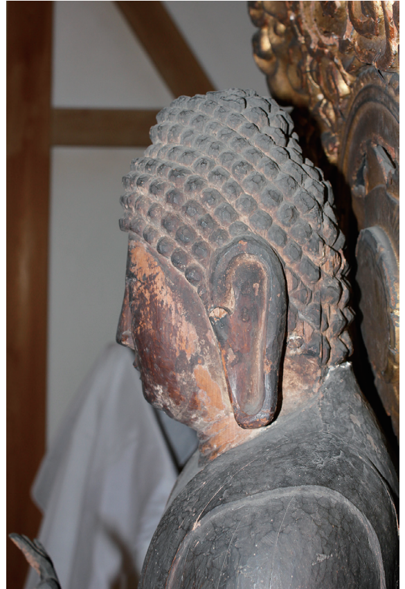
【写真3】 来迎寺木造阿弥陀如来立像(頭部左側面)