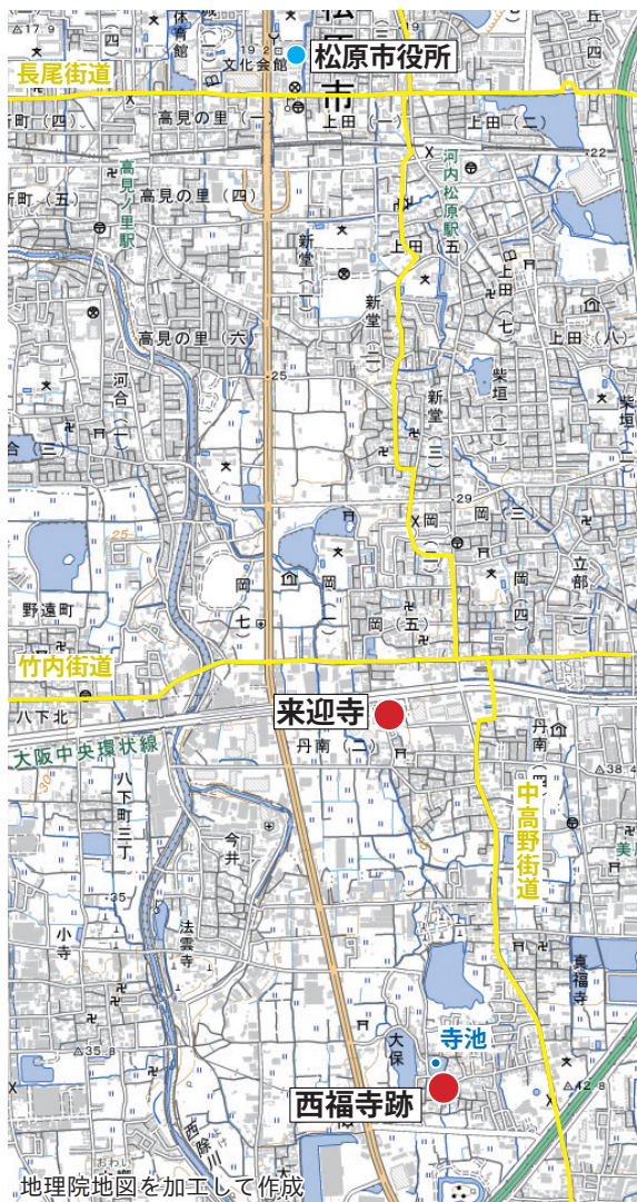
【図1】 来迎寺及び西福寺跡位置図