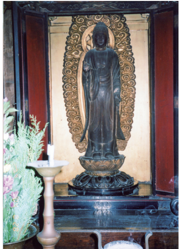
【写真5】 大保・西福寺での安置状況(2)