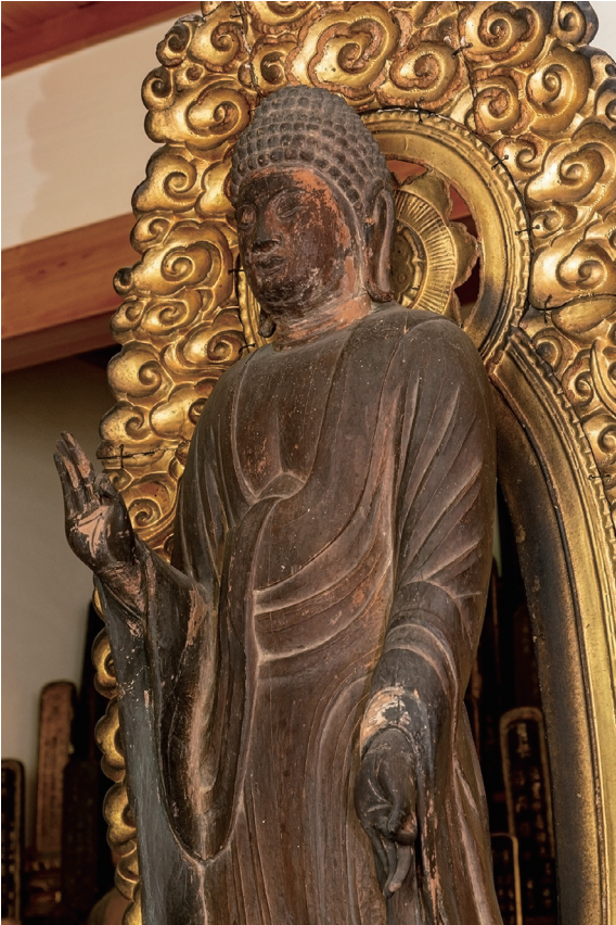
【写真2】 来迎寺木造阿弥陀如来立像(上半身)