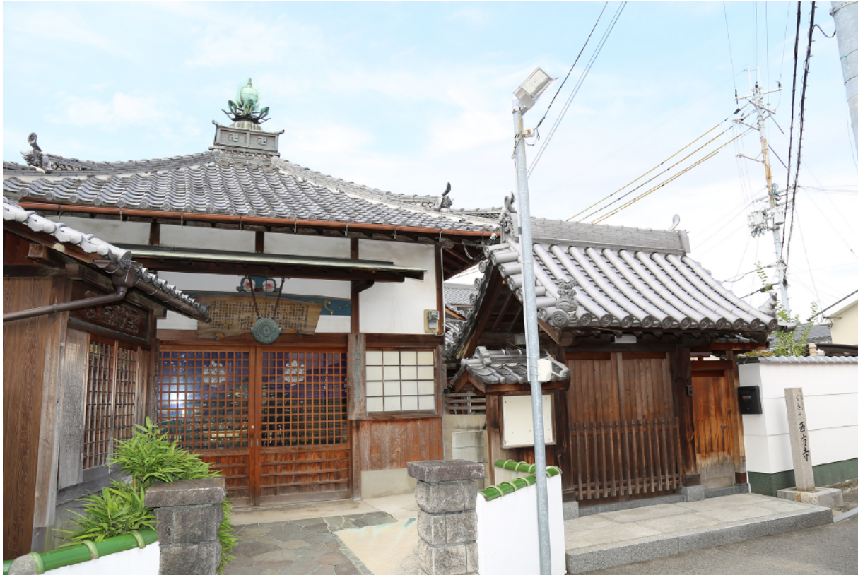
西方寺山門及び観音堂（東から）