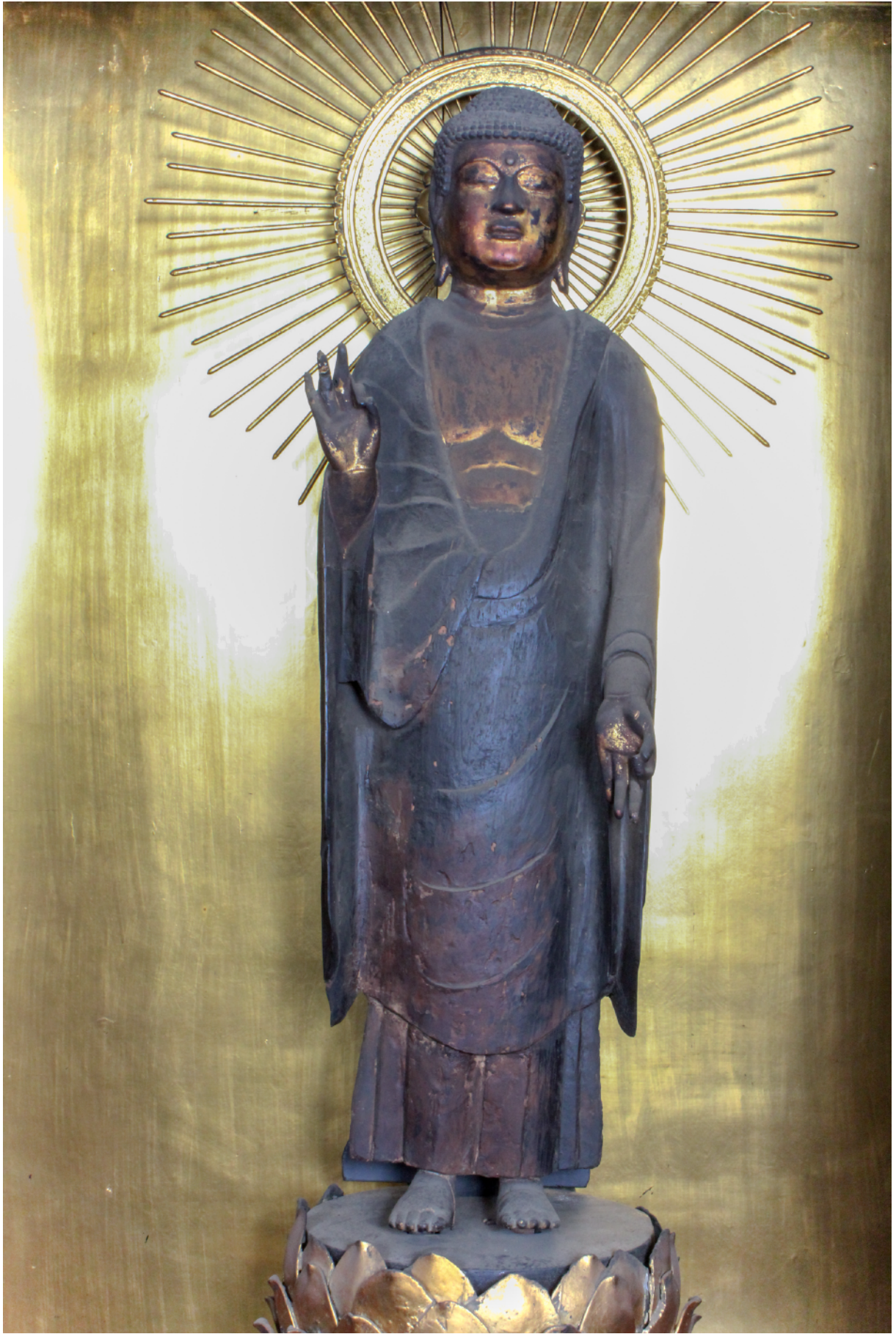
西方寺 木造 阿弥陀如来立像