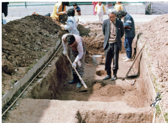
写真2 昭和54(1979)年の発掘調査風景(東から)