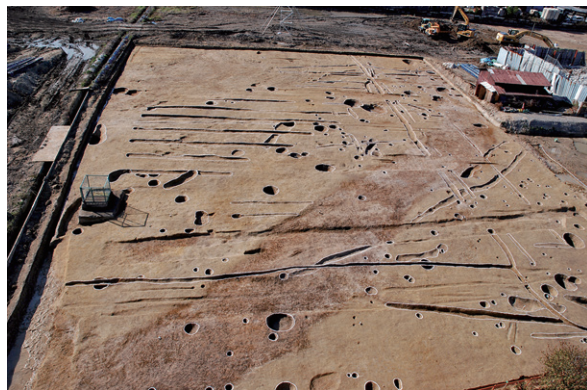
写真4 古墳時代の遺構が多く見つかった調査区