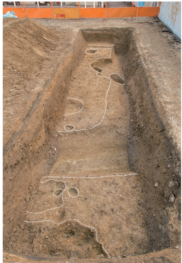
写真3 調査区全景(西から)