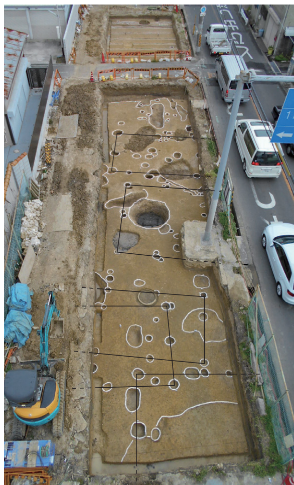
写真6 平安時代の屋敷と畑（西から）