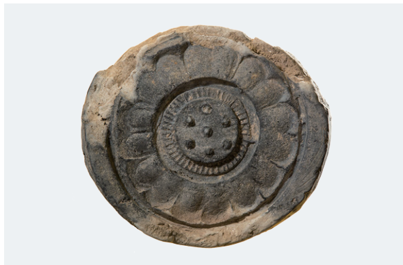
写真1 今回出土した複弁蓮華文軒丸瓦(直径15cm)

今回の発掘調査で瓦が出土したことにより縁起の伝える創建年が正しい可能性が更に高まりました。