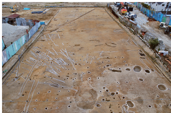
写真5 古代の遺構が多く見つかった調査区