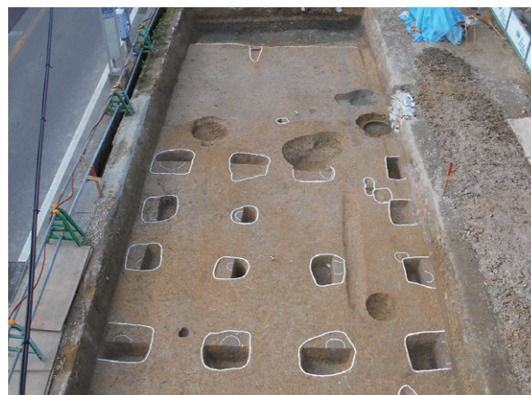
写真7 平安時代の中心的な建物（東から）