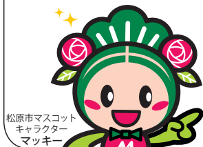
松原市マスコット キャラクター マツキー