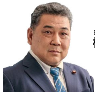
日本共産党 植松栄次