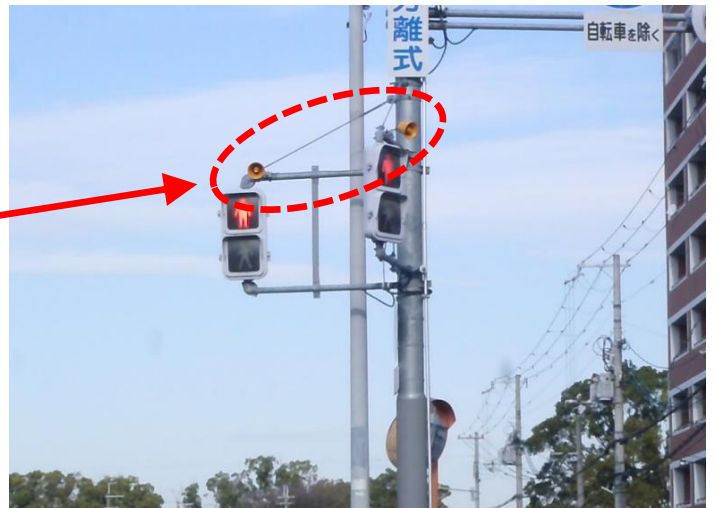
視覚障害者用付加装置の設置