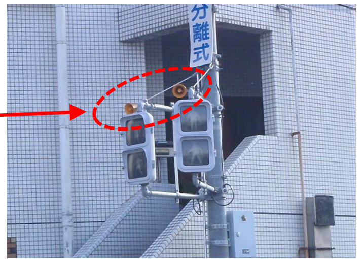
視覚障害者用付加装置の設置