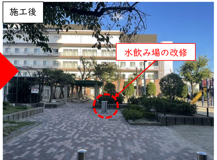
園路及び水飲み場の改修