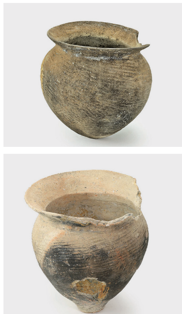
写真4 弥生時代後期～終末期の土器(左下の土器は捨てる前にわざと穴を開けている)