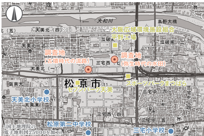
図1 発掘調査を行った地点の位置図(縮尺1:25,000)