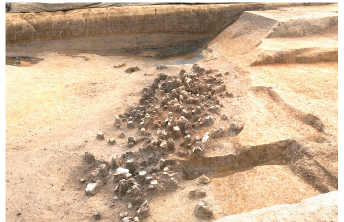
写真3 弥生時代後期～終末期の土器が捨てられた川跡の窪地