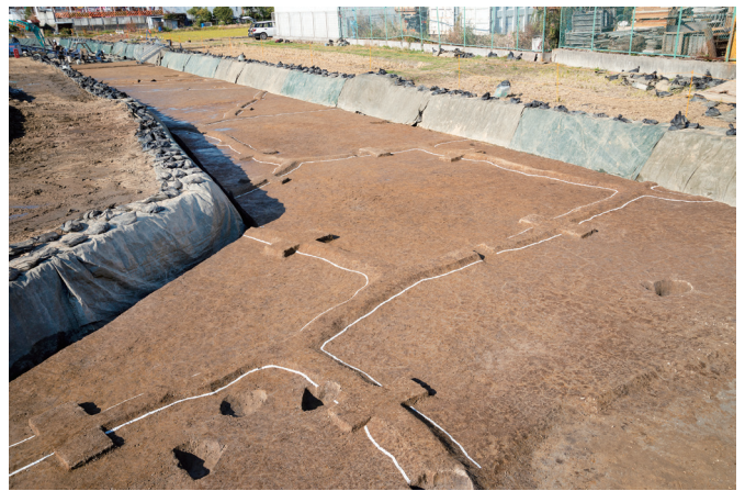
写真3 地形に合わせた大きさや形で区画された水田(南東から)