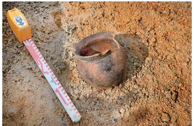
写真4 流路を埋める砂礫の中からみつかった古墳時代の土器