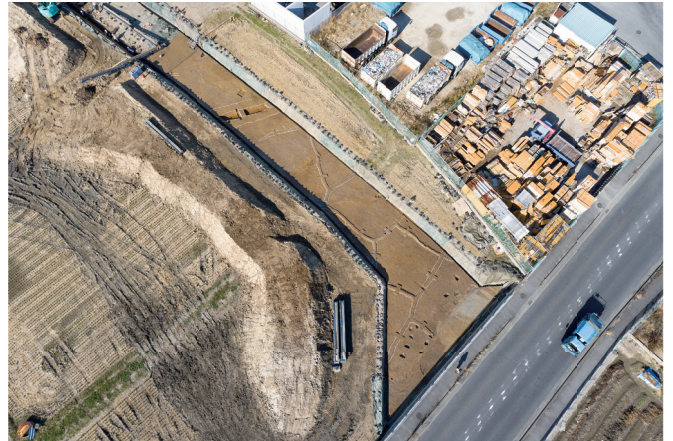
写真2 砂でおおわれていた弥生時代後期の水田(右上が北)