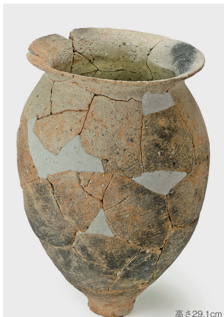
写真2 溝に捨てられた煮炊き用の土器