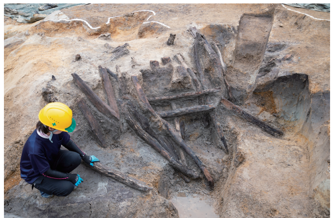
写真5 木杭を打ち込んで水の流れを制御する水制(南から)