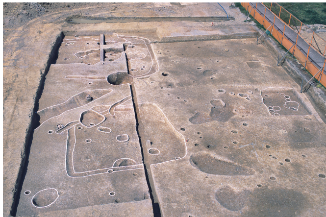
写真1 弥生時代後期の竪穴建物跡(手前の建物跡が幅約5.5m)

調査地の南側では弥生時代中期(紀元前2世紀～1世紀)の石器や土器も見つかっています。そのため、今回の調査では見つかりませんが、周辺により古い時代の集落があったと考えられます。