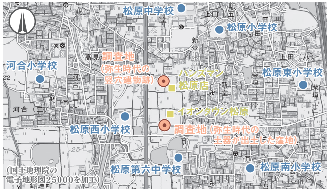
図1 発掘調査を行った地点の位置図(縮尺1:25,000)

発掘調査を行った場所は新堂遺跡の南西端にあたり、泉北台地と瓜破台地(河内台地)にはさまれた扇状地に立