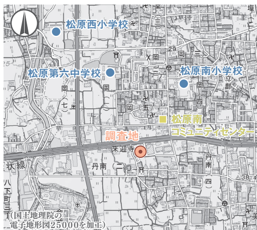
図1 調査地位置図(縮尺1:25,000)

御殿様御墓所と記されている「丹南村明細帳」などの文献史料から元文5年(1740)には墓の存在がわかるため、五輪塔は寛永7年～元文5年の間に建立されたものと考えられます。