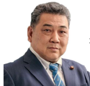
日本共産党 植松栄次