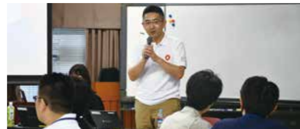
▲松原市役所で講演中の筆者