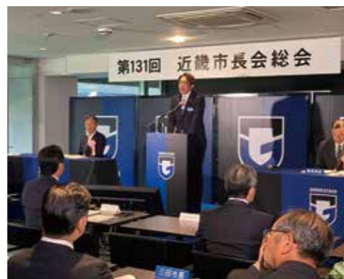
▲会長就任あいさつの様子