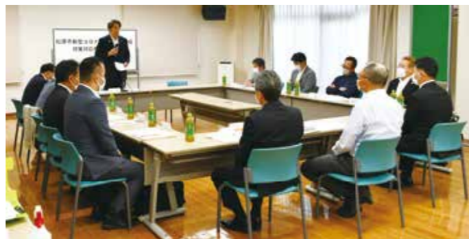
▲第1回委員会の様子

●委員会構成団体 一般社団法人松原市医師会、一般社団法人松原市薬剤師会、医療法人徳洲会松原徳洲会病院、社会医療法人垣谷会明治橋病院、社会医療法人阪南医療福祉センター阪南中央病院、大阪府藤井寺保健所、松原市、松原市教育委員会