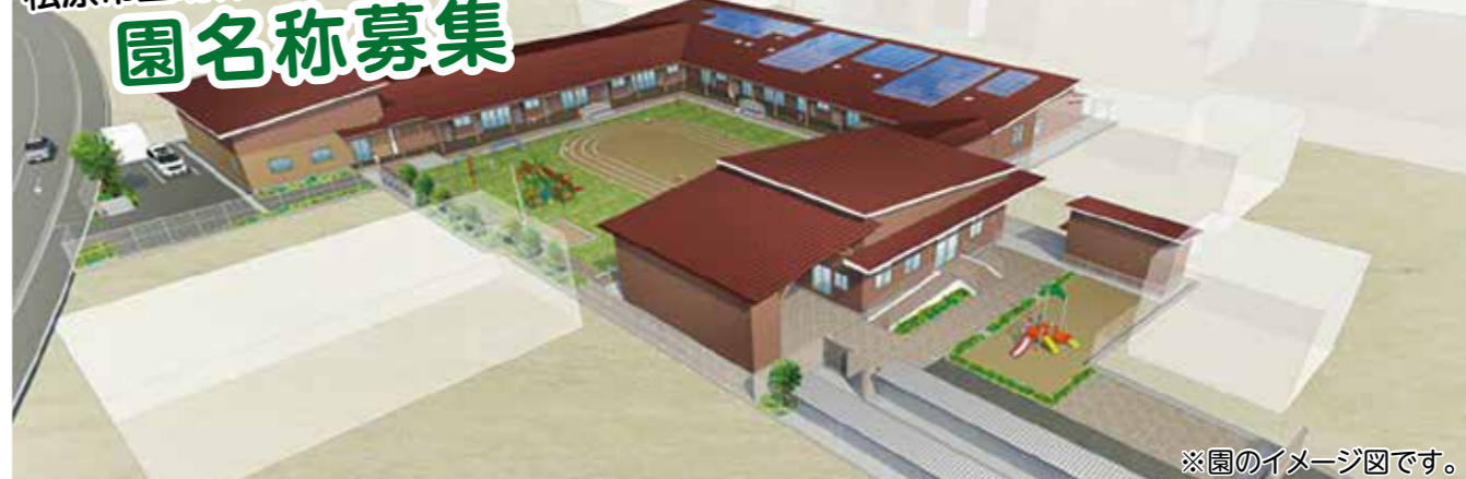
※園のイメージ図です。

地域に親しまれ、子どもや子育て世帯が安心して 楽しく過ごせる場となるような名称を募集します