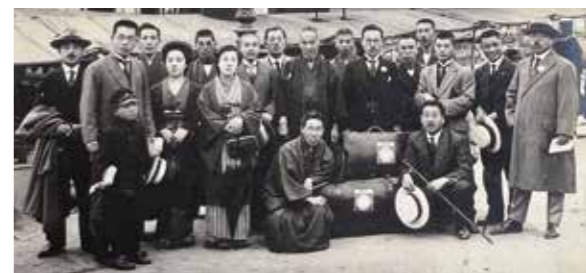
▲102年前にアメリカ留学した祖父(右から7番目)

このような万博の場を活かすポイントは、「万博を契機とした交流」にあります。例えば、万博の機会を活用した姉妹都市交流やセーフ・コミュニティとの連携、海外パビリオンのスタッフやインバウンド客に松原の観光資源や地域産品に触れて頂く等。来月からは万博の魅力についてお伝えします。